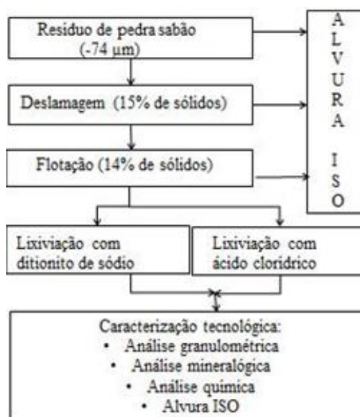
Figura 1. Fluxograma de purificação e caracterização da amostra de resíduo de pedra sabão.

Na Figura 1 está apresentado o fluxograma dos ensaios de purificação e caracterização da amostra de resíduo de pedra sabão.